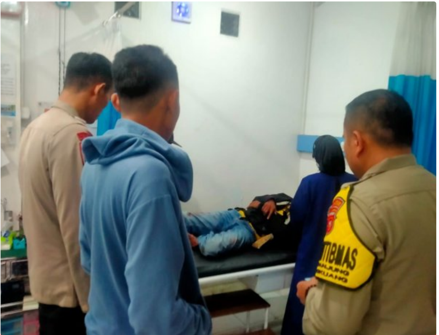
Dok. Giat Polsek Cangkuang (31/3/24)

CANGKUANG - Quick Respon Piket Fungsi Polsek Cangkuang Polresta Bandung, berikan pertolongan kepada korban kecelakaan tunggal di Jl Soreang Banjaran Desa Cangkuang, Minggu, (31/3) Pagi.